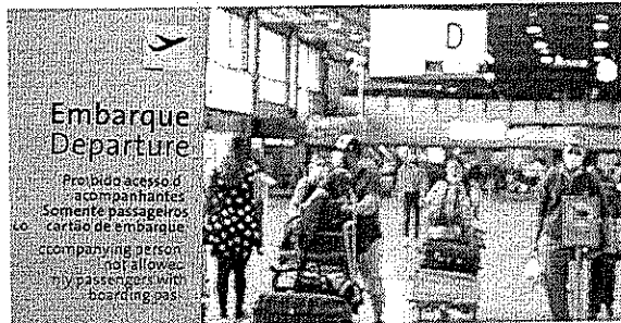
Uma série de protocolos em vigor desde o início da pandemia de covid-19 foi mantida.

Em documento, a Anvisa informou que o cenário epidemiológico atual permite que algumas medidas sanitárias tomadas em 2020 sejam atualizadas, como o uso obrigatório das máscaras. "Diante do atual ce-