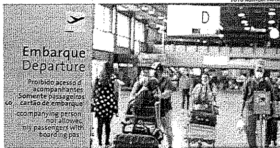
Uma série de protocolos em vigor desde o início da pandemia de covid-19 foi mantida

Em documento, a Anvisa informou que o cenário epidemiológico atual permite que algumas medidas sanitárias tomadas em 2020 sejam atualizadas, como o uso obrigatório das máscaras. "Diante do atual ce-