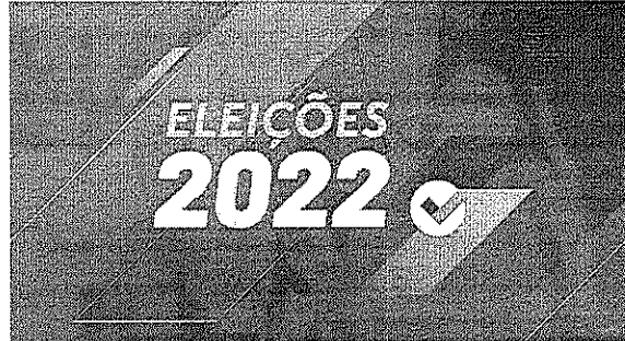
Candidatos estão autorizados a fazer caminhadas, carreatas com carro de som e a distribuir material de campanha até as 22h

No Norte do país, 2.909 pessoas disputam uma vaga de deputado estadual. No Pará, 638 pessoas concorrerão a 41 vagas. No Amazonas, são 430 candidatos para 24 vagas. No Amapá, são 358 disputando 24 vagas. Em Rondônia são 417; em Roraima, 402; e no Tocantins são 310 disputando 24 vagas em