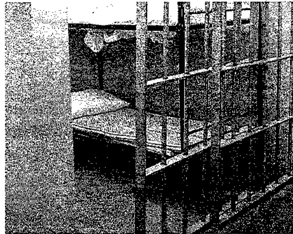
Os acusados estavam presos há mais de 60 dias, desde que ocorreu a operação da Polícia Civil em maio

O Ministério relatou ainda que houve despacho do colegiado acatando o pedido e determinando vistas dos autos à autoridade policial no dia 23 de junho. "Os autos foram novamente remetidos ao Ministério Público no dia 29 de junho de 2022,