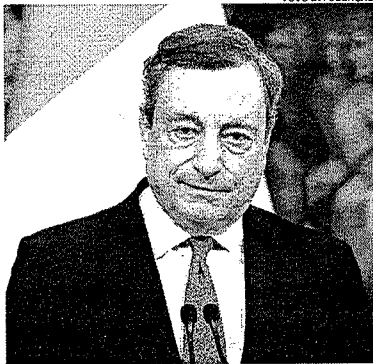
Mario Draghi ascendeu ao poder em fevereiro de 2021

Aprovado no Parlamento por 172 votos a 39 - sem a participação dos deputados do M5S -, o voto de confiança