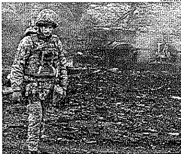
Ucrânia admitiu que pode ser obrigada a recuar na cidade de Sevastopol, palco de intensos combates

A Turquia chamou a proposta dos corredores marítimos