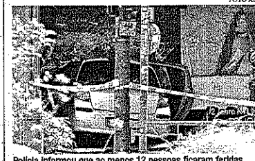
Polícia informou que ao menos 12 pessoas ficaram feridas

Mais recentemente, em 2020, cinco pessoas morreram depois que um alemão de 51 anos embriagado invadiu uma área destinada a pedestres com seu SUV na cidade de Trier, no sudoeste do país. Autoridades disseram que o homem não era motivado por crenças políticas ou religiosas.