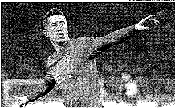
O Brasil não teve nenhum indicado entre os finalistas, tanto na categoria masculina como na feminina

O polonês frustrou a esperança do argentino escar com o troféu pela sétima vez e reafirmar sua condição de maior ganhador da história. Salah tentava ser o primeiro africano melhor do mundo desde que o at-