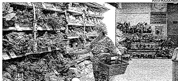
Em alimentação e bebidas, principais destaques foram aumentos da carne (1,32%), frutas (3,40%), café moído (4,75%) e cenoura (27,64%)

O resultado até sinaliza uma desaceleração frente a dezembro de 2021, quando o avanço havia sido de 0,73%, mas o IPCA segue em dois dígitos no acumulado de 12 meses. A alta acumulada até janeiro chegou a 10,38%. É a maior desde novembro de 2021 (10,74%). No recorte de 12 meses até janeiro, trata-se da taxa mais elevada desde 2016 (10,71%). O IPCA está distante da meta de inflação perseguida pelo Banco Central, que é de 3,50%. O teto é de 5%. Por isso, para tentar