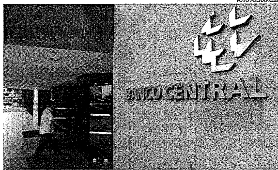
Superávit primário de R$16,7 bilhões neste ano foi registrado ante déficit de R$ 87,6 bilhões em agosto de 2020

Expectativa. Ao defender a redução de impostos como saída para a queda nos valores, o presidente Jair Bolsonaro disse que o preço do gás de cozinha poderá cair pela metade. Em Roraima, Bolsonaro celebrou a decisão do governador local, Antônio Denarium, de reduzir o valor do ICMS.