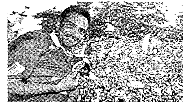
UM ÍDOLO Ele foi eleito várias vezes como o maior jogador de futsal do mundo. Com vocês, Falcão, o homem que arrostou

O senador Eduardo Girão não esquece o seu Fortaleza. Na quarta-feira passado este tricolor de verdade fez importante pronunciamento sobre a presença do Leão na Copa da Libertadores. Girão fez um retrospecto da trajetória do clube da garotada desde a Série C, passando para a Série B e agora na Série A, com vaga assegurada no maior certame de futebol da América Latina.