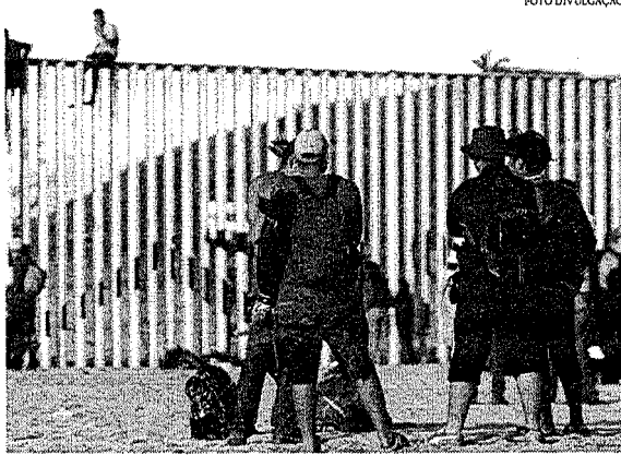
A principal nacionalidade dos migrantes detidos tentando entrar nos EUA é mexicana

Agentes americanos detiveram mais de 1,7 milhão de migrantes na fronteira dos Estados Unidos com o México durante o ano fiscal de 2021, encerrado em setembro. A cifra é a mais alta já registrada, de acordo com dados do Serviço de Alfândegas e Proteção das Fronteiras (CBP, na sigla em inglês) obtidos pelo jornal The Washington Post. As travessias legais cresceram no período após a posse do presidente Joe Biden, em janeiro. Os meses com mais detenções, de acordo com os registros, foram julho e agosto - em cada um, mais de 200 mil migrantes foram presos entre os dois países, quando a média mensal em anos anteriores era 50 mil.