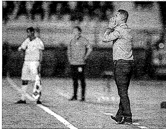
Há a possibilidade de o time ser punido pelo o acontecimento, tendo a chance de perder o mando de campo em até 10 partidas

Torcedores do Grêmio atacam cabine do VAR após derrota Diego Vaza - 31º out. 21/Reuters Torcedores vestidos com uniformes do time batendo em cabine transparente "O Grêmio Foot-Ball Porto Alegre informa que está empregando todos os esforços necessários para, além de quem já foi reconhecido e apresentado aos órgãos competentes, identificar os demais transgressores em relação ao evento ocorrido ao final da partida entre Grêmio e Palmeiras, na Arena, deixando o critério das autoridades legitimadas para tanto, que os infratores sejam punidos na forma da lei", disse a agremiação.