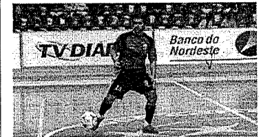
CRAQUE DE BOLA Leitor me manda esta foto de um jovem craque do nosso futsal, mas não disse o nome dele. Eu sei que é craque mesmo, mas também não me lembro do seu nome.