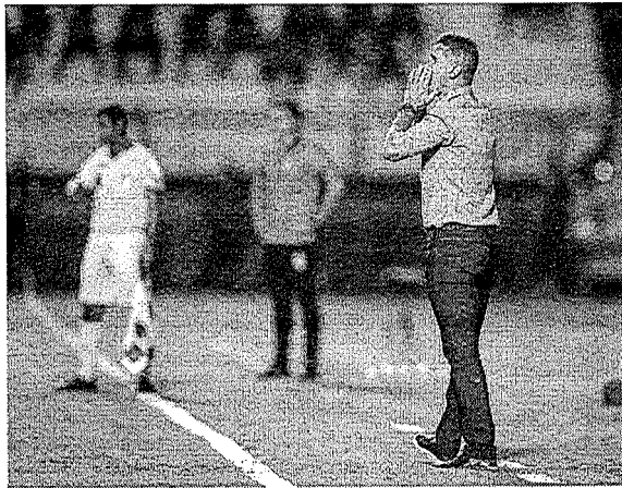
Há a possibilidade do time ser punido pelo o acontecimento, tendo a chance de perder o mando de campo em até 10 partidas

Torcedores do Grêmio atacam cabine do VAR após derrota Torcedores vestidos com uniformes do time batendo em cabine transparente "O Grêmio Foot-Ball Porto Alegre informa que está empregando todos os esforços necessários para, além de quem já foi reconhecido e apresentado aos órgãos competentes, identificar os demais transgressores em relação ao evento ocorrido ao final da partida entre Grêmio e Palmeiras, na Arena, deixando a critério das autoridades legítimas para tanto, que os infratores sejam punidos na forma da lei", disse a agremiação.