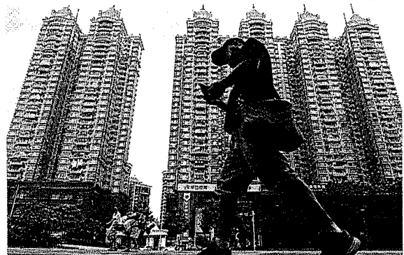
Homem caminha diante de complexo habitacional da empresa Evergrande em Guangzhou, na China

O temor de um calote bilionário da Evergrande, uma gigante do mercado imobiliário chinês, derrubou Bolsas pelo mundo, provocando um mergulho no pregão no Brasil. O Ibovespa, principal índice da B3, recuou 2,33%, e fechou com 108.843 pontos. O dólar subiu 0,81%, cotado a R$ 5,3320. Nos Estados Unidos, Dow Jones, S&P 500 e Nasdaq caíram 1,78%, 1,70% e 2,19%, respectivamente. Na Europa, o índice Euro Stoxx 50 (zona do euro) retrocedeu 2,11%. Também caíram as Bolsas de Londres (-0,86%), Paris (-1,74%) e Frankfurt (-2,31%).