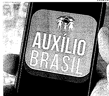
Instituição avalia que dá para expandir Auxílio Brasil

Com isso, o orçamento do programa social ficaria em R$ 48,7 bilhões. A proposta de Orçamento do governo prevê R$ 34,7 bilhões para o Auxílio Brasil, sem expansão