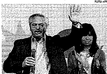
As renúncias se dão três dias depois de a frente governista ser derrotada

TEMPO NO BRASIL (Máxima) São Paulo 19°C • Brasília 33°C • Rio 24°C FALE COM A GENTE! WWW.OSTADO.COM.BR e-mail: geral@oestado.com.br