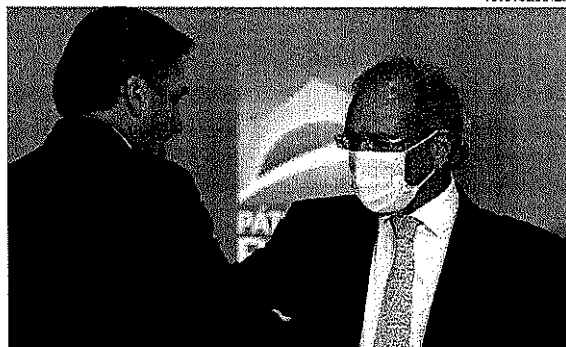
Estratégia do governo é deixar que o Congresso assuma a liderança da articulação do Imposto digital

A estratégia do governo é deixar que o Congresso assuma a liderança da articulação pela aprovação de um novo imposto digital, nos moldes da extinta CPMF