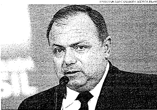
Pazuello será questionado sobre a atuação do governo durante o colapso em Manaus

O mais provável é que a comissão trabalhe de maneira