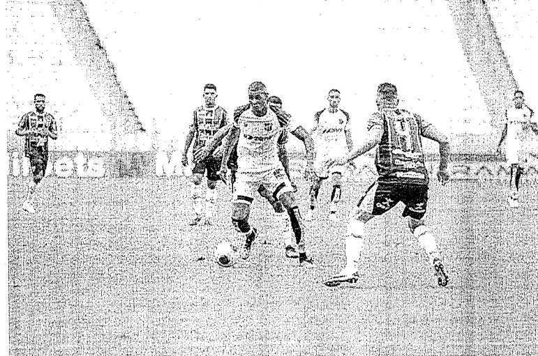
No momento, o Alvinegro de Porangabussu vem tendo que enfrentar um calendário apertado em razão da pandemia de covid-19

Em meio a maratona de jogos entre diversas competições, o Alvinegro de Porangabussu tenta se manter focado para a partida decisiva de hoje a noite (20) contra o Bolívar, na Arena Castelão, pela quinta rodada da fase de grupos da Copa Sul-Americana. O Vozão, que atualmente tem seis pontos em seu grupo, tendo a possibilidade de alta classificação para a fase eliminatória, vem buscando manter um equilíbrio entre os diversos campeonatos a disputar. Promovendo um rodízio e poupando jogadores importantes em algumas partidas. No entanto, a equipe de Guto Ferreira enfrentou nesta semana uma situação rara,