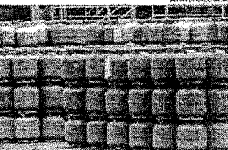
O auxílio será pago de dois em dois meses, cujo valor será da metade do preço médio do botijão de gás, conforme levantamento da ANP

Miédres chefes de família têm prioridade para receber o benefício, assim como as mulheres vítimas de violência. Paralelamente, foi feito um convênio com o Conselho Nacional de Justiça (CNJ). Além dos critérios básicos de pagamento, a concessão do benefício será feita obedecendo à seguinte ordem de critérios, para famílias que sucessivamente: