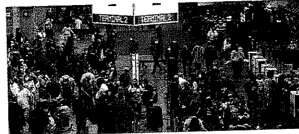
A greve durou cinco dias e paralisou voos antes do Natal

Os pilotos e comissários de empresas aéreas aprovaram a proposta de reajuste salarial e encerraram a greve que durou cinco dias e paralisou voos na semana que antecedeu o Natal. A proposta, que