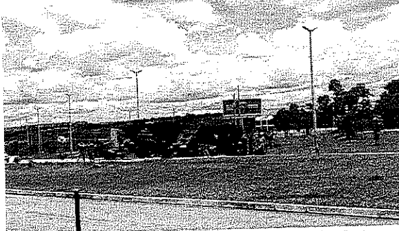
A Polícia prendeu o suspeito do crime e o explosivo foi desarmado pelo esquadrão antibombas

Na versão dada por ele aos policiais, o investigado mencionou o artefato localizado neste sábado (24) nas imediações do aeroporto e também planos da instalação de explosivos em postes de energia próximos a uma