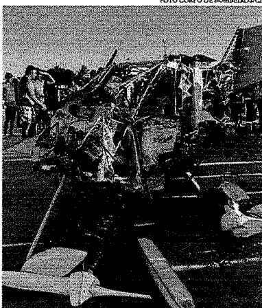
Um ultraleve em voo.

O especialista destaca que os ultraleves se destinam somente para uso pessoal. "O proprietário pode utilizar para lazer e viajar, mas nunca operar de forma comercial. O uso é igual ao de um avião de grande porte, é preciso ter habilitação específica e registro na Anac [Agência Nacional da Aviação Civil]". Sobre os acidentes, o piloto avalia que o ideal é que não ocorram, mas con-