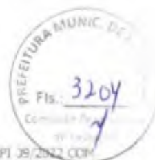
TABELA: SEINFRA 027.1 E SINAPI 39/2012 COM DESCONEXÃO BDI: 31,25%

OBRA: CONSTRUÇÃO DE CRECHE TIPO I - PADRÃO FNDE LOCAL: RUA PRESIDENTE ROOSEVELT, S/N, BOA VISTA - ITAPIPOCA/CE REF.: TOMADA DE PREÇOS Nº 23.06.01/TP RAZÃO SOCIAL: CLEZINALDO S. DE ALMEIDA CONSTRUÇÕES - EPP CNPJ: 22.575.652/0001-97