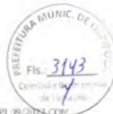
TABELA: SEINFRA 327.1 E SINAPI 09/2022 COM DESONERAÇÃO BDI: 31,25%

OBRA: CONSTRUÇÃO DE CRECHE TIPO I - PADRÃO FNDE LOCAL: RUA PRESIDENTE ROOSEVELT, S/N, BOA VISTA - ITAPIPOCAÇE REF.: TOMADA DE PREÇOS Nº 23.06.21/TP RAZÃO SOCIAL: CLEZINALDO S. DE ALMEIDA CONSTRUÇÕES - EPP CNPJ: 22.575.652/0001-97