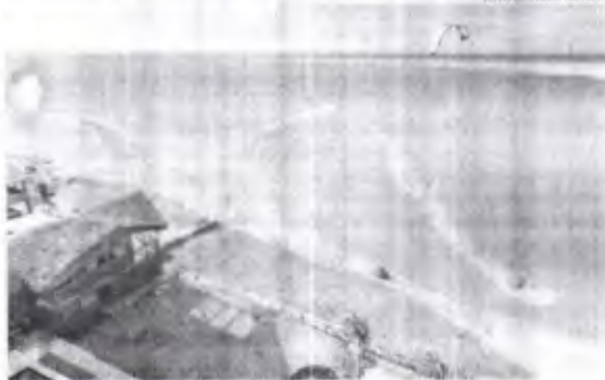
Na próxima semana, o voo direto entre Fortaleza e Buenos Aires será retomado