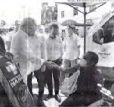
O prefeito considera que a ampliação é uma forma de levar mais dignidade à população mais vulnerável

Nesta quinta-feira, 25, o prefeito de Fortaleza, José Sarto, anunciou a ampliação do "Programa Consultório na Rua" na capital cearense. Criado em 2011, pelo Política Nacional de Atenção Básica do Governo Federal, o objetivo da iniciativa é levar atendimento médico e social para pessoas em situação de rua ou em condições precárias. De acordo com as informações disponibilizadas pela Secretaria Municipal de Saúde (SMS), o programa funciona como uma estratégia de inclusão e contribui para a redução das desigualdades sociais. "É um programa fantástico. A gente sabe que na pandemia houve uma ascensão da população de rua e, evidentemente, essas pessoas têm necessidades semelhantes aos pacientes comuns", lembrou o prefeito.