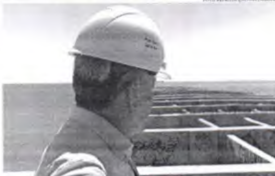
A ação da gestão visa resgatar o patrimônio ativo, histórico e turístico representado pela ponte

A Prefeitura de Fortaleza afirmou ter realizado as primeiras iniciativas para reavaliar a obra da Praia de Iracema em janeiro de 2022. Na ocasião, foi elaborada e concluída