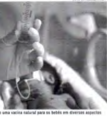
O leite materno funciona como uma vacina natural para os bebês em diversos aspectos

Nesta quinta-feira, 18, a Prefeitura de Fortaleza inaugurou, no bairro Alto da Balança, uma nova sala de coleta de leite humano no posto de saúde César Calix. A novidade faz parte da programação do Município para o Dia Mundial da Doação de Leite Humano, que é celebrado hoje, 19. Em diferentes unidades de saúde, os profissionais dos bancos de leite chamam a atenção para a problemática do baixo estoque. Em Fortaleza, de acordo com a Prefeitura, o Hospital da Mulher está precisando de doações por esse motivo. Em Sobral, o Hospital Regional Norte (HRN), revela que necessita de 60 litros por mês para suprir as necessidades dos bebês prematuros internados na UTI Neonatal, porém, a coleta só alcança cerca de 20 litros mensais.