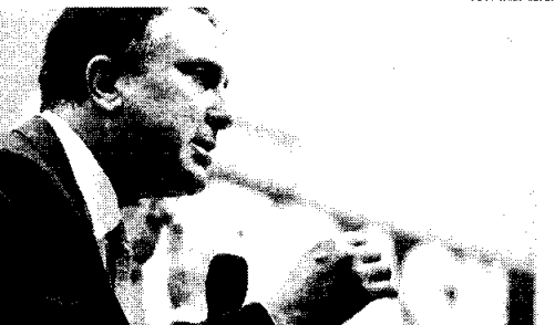
Para o ministro, o momento é de avaliação dos cursos de licenciatura não presenciais

O ministro da Educação Camilo Santana afirmou que o governo federal cogita proibir que cursos de licenciatura tenham 100% da carga horária na modalidade de ensino à distância (EaD) e planeja outras mudanças nos cursos de formação de professores online. Para o ministro, o momento é de avaliação dos cursos de licenciatura não presenciais que em novembro tiveram as autorizações para novos cursos 100% EaD suspensas por 90 dias. "A ideia do ministério é não permitir mais cursos sempre EaD. Então, vamos definir se vão ser 50%, 30% [da carga horária]."