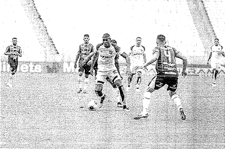
No momento, o Alvinegro de Porangabussu vem tendo que enfrentar um calendário apertado em razão da pandemia de covid-19

Em meio a maratona de jogos entre diversas competições, o Alvinegro de Porangabussu tenta se manter focado para a partida decisiva de hoje a noite (20) contra o Bolívar, na Arena Castelão, pela quinta rodada da fase de grupos da Copa Sul-Americana. O Vozão, que atualmente tem seis pontos em seu grupo, tendo a possibilidade alta de classificação para a fase eliminatória, vem buscando manter um equilíbrio entre os diversos campeonatos a disputar. Promovendo um rodízio e poupando jogadores importantes em algumas partidas.