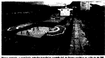
Nesse cenário, o comércio exterior brasileiro contribuirá de forma positiva no cálculo do PIB

A balança comercial brasileira deve registrar superávit recorde de US$ 86,472 bilhões em 2023, um aumento de 40,5% em relação aos US$ 61,526 bilhões apurados em 2022. O dado foi alcançado após revisão do indicador pela Associação de Comércio Exterior do Brasil (AEB) e divulgado nesta quarta-feira (19/07). Segundo a entidade, a projeção é de exportações de US$ 323,937 bilhões, com redução de 3% em relação aos US$ 334,136 bilhões observados em 2022. Além disso, a estimativa é de importações de US$ 237,465 bilhões, recuo de 13,9% em relação aos US$ 272,610 bilhões realizados no ano passado.