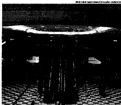
Aeroporto de Congonhas (SP): Infraera fica com terminais menores

DEBATE. Com a expectativa de a Advocacia-Geral da