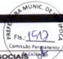
TABELA DE ENCARGOS SOCIAIS