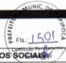
TABELA DE ENCARGOS SOCIAIS