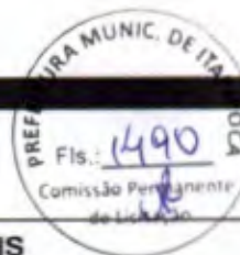
TABELA DE ENCARGOS SOCIAIS