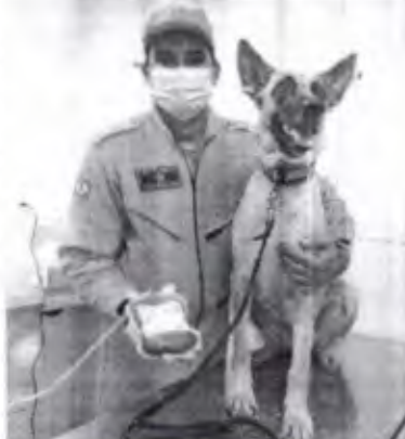
Atenas do CIMC, da Força Armada e da Receita Federal participam regularmente das doações

O estabelecimento aproveita a campanha de "Junho Vermelho" para conscientizar sobre a importância da doação de sangue para pets