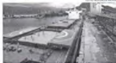
Um terminal de comércio exterior brasileiro contribui para o cálculo do PIB

A balança comercial brasileira deve registrar superávit recorde de US$ 86,472 bilhões em 2023, um aumento de 40,3% em relação aos US$ 61,526 bilhões apurados em 2022. O dado foi alcançado após revisão do indicador pela Associação de Comércio Exterior do Brasil (ACEB) e divulgado nesta quarta-feira (19/07). Segundo a entidade, a projeção é de exportações de US$ 323,937 bilhões, com redução de 3% em relação aos US$ 334,136 bilhões observados em 2022. Além disso, a estimativa é de importações de US$ 237,465 bilhões, recuo de 12,9% em relação aos US$ 272,610 bilhões realizados no ano passado.