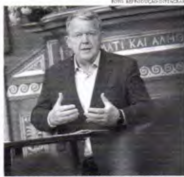
O ministro dinamarquês acredita que a cúpula não deve contar apenas com aliados da Ucrânia

te lembrar que, após a reunião do G7, no Japão, o presidente Lula, que participou do evento como convidado no último fim de semana, reforçou que mantém seu posicionamento sobre o conflito no leste europeu. "Ouvir atentamente o discurso do Zelensky no encontro. Ele certamente ouviu o meu discurso atentamente no encontro. E se continuou com a mesma posição que estava antes", disse o líder brasileiro. Há meses Lula tem defendido a criação de um grupo de países neutros que tenham interesse em mediar uma so-