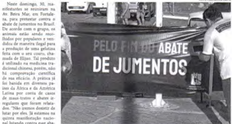
Neste domingo, diversas cidades brasileiras tiveram manifestações pela causa

O ato faz parte de um movimento nacional que chama a atenção para o problema que tem causado a redução da população de jumentos no país