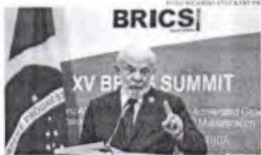
Mostrando um abraço de boas-vindas, o presidente afirmou que o Brics não é mais de nove

O presidente negou tal possibilidade, mas reforçou a importância de tais nações no cenário geopolítico mundial. "São três países que não podem estar fora de qualquer agrupamento político que você queira fazer. Seja para discutir economia, ciência e tecnologia ou cultura. Essa gente tem que estar participando e outros países não participar porque têm muitos países perdidos", apontou. Especificamente sobre o Irã, Lula disse estar feliz