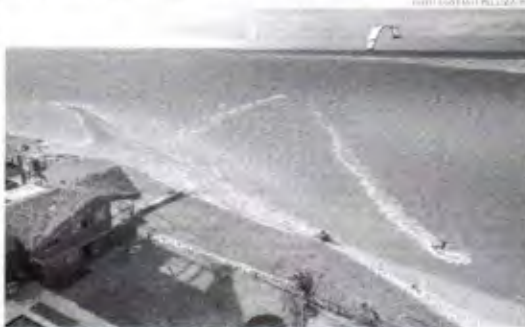
Na próxima semana, o voo direto entre Fortaleza e Buenos Aires será retomado

As atividades turísticas do Ceará estão se destacando nacionalmente. Dados do Instituto Brasileiro de Geografia e Estatística (IBGE), inclusive, já revelaram que, em abril, por exemplo, o estado teve uma alta na receita normal do setor de 4%, se comparado aos três meses de março. Tal resultado ficou acima da média nacional, elevada em 0,5%. Além disso, se avaliada a receita nominal do Ceará dos últimos 12 meses, é possível perceber alteração de 37,5%. "O turismo cearense é, hoje, um dos mais bem traçados quando comparado ao desempenho da atividade nacionalmente", afirma a titular da Secretaria de Turismo do Estado, Yvanna Albuquerque.