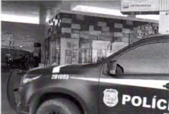
A operação ocorreu em Juazeiro do Norte e em Feira de Santana, na Bahia.

Nesta terça-feira, 27, o Ministério Público do Ceará deflagrou uma operação para investigar suspeitas de peculato, fraude licitatória, falsidade ideológica e associação criminosa na gestão do sistema de abastecimento de mais de 300 veículos da Prefeitura de Juazeiro do Norte, localizada a cerca de 493 km de Fortaleza. No total, os contratos que estão sob análise estão orçados em mais de 8 milhões de reais. A ação aconteceu através do Grupo Especial de Combate à Corrupção (GECOC) e da 13ª Promotoria de Justiça do município da região do Cariri.