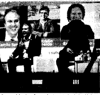
O painel de Camilo Santana discutiu o papel da educação no enfrentamento das desigualdades

De acordo com ele, entre as metas da atual gestão do Ministério da Educação (MEC) se destacam temas como a garantia da qualidade da educação pública e a inclusão. "O presidente Lula nos colocou em uma missão de construir novas ações de política que primeiro pudessem fortalecer a educação básica", destacou, acrescentando que os anos mais importantes para o aprendizado são aqueles que integram os primeiros momentos das crianças na escola. Nesse sentido, o titular do MEC ressaltou a relevância da alfabetização na idade certa dentro de um contexto educacional mais amplo, afirmando que tal medida é capaz de reduzir os índices de reprovação, de evasão e de abandono escolar, cenário que piorou durante a pandemia de covid-19. O ministro revelou ainda que dados do Instituto Nacional de Estudos e Pesquisas Edu-