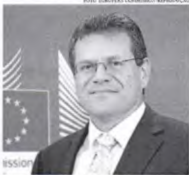
Maros Sefcovic, vice-presidente da Comissão Europeia, afirmou nesta quarta-feira, 07, que as condições necessárias para que o acordo de livre comércio que está sendo negociado há mais de 20 anos com as nações que integram o Mercosul não foram atendidas.

O vice-presidente executivo da Comissão Europeia, Maros Sefcovic, afirmou nesta quarta-feira, 07, que as condições necessárias para que o acordo de livre comércio que está sendo negociado há mais de 20 anos com as nações que integram o Mercosul não foram cumpridas. "A avaliação da Comissão é que as condições para a conclusão do acordo com o Mercosul não foram atendidas", pontuou. Nas últimas semanas, o texto passou por uma avaliação política minuciosa enquanto protestos de setores agrícolas europeus em países como a França, levantando o debate sobre o que prejudiciais seriam sendo as importações baratas de países que não seguem as mesmas normas impostas às nações que fazem parte da União Europeia.