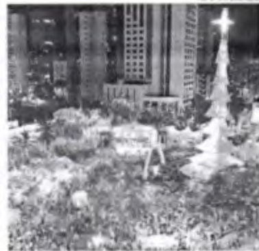
Na inauguração, Coral de Luz fará sua primeira apresentação nas sacadas do Hotel Excelsior

Considerado o maior evento natalino entre as capitais do Brasil, o Ceará Natal de Luz terá início no próximo dia 17 de novembro