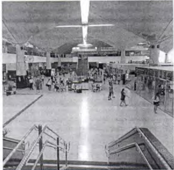
Mais de 11 mil pessoas deverão passar pelos terminais na próxima sexta-feira, 22

Durante os cinco dias citados, mais de 1,710