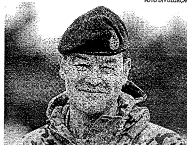
Sanders assumiu no último dia 13 e lembrou ser o primeiro chefe do Estado-Maior, nome oficial do posto

A luz, ou melhor dizendo, à sombra da Guerra da Ucrânia, o Reino Unido deve se preparar para retomar o papel histórico de "lutar na Europa, mais uma vez", e "forjar um Exército capaz de lutar ao lado dos nossos aliados e de derrotar a Rússia em combate". As palavras são do general Patrick Sanders, novo comandante do Exército britânico, em uma carta aos soldados divulgada no domingo (19) pela imprensa do país. Ele assumiu no último dia 13 e lembrou ser o primeiro chefe do Estado-Maior, nome oficial do posto