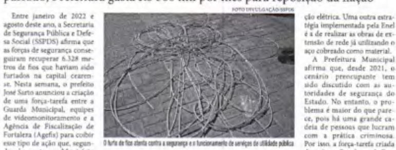
O furto de fios acaba com a segurança e o funcionamento de serviços de utilidade pública

Ao todo, foram recuperados mais de 6 mil metros de cabos desde o ano passado; Prefeitura gasta R$ 500 mil por mês para reposição da fiação