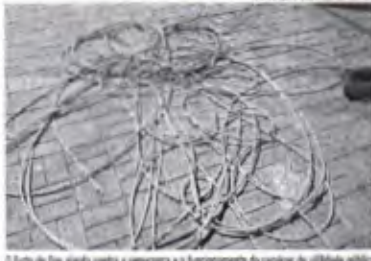
Os fios de aço já estão cortados e separados e o lançamento dos serviços de utilidade pública

Ao todo, foram recuperados mais de 6 mil metros de cabos desde o ano passado; Prefeitura gasta R$ 500 mil por mês para reposição da fiação