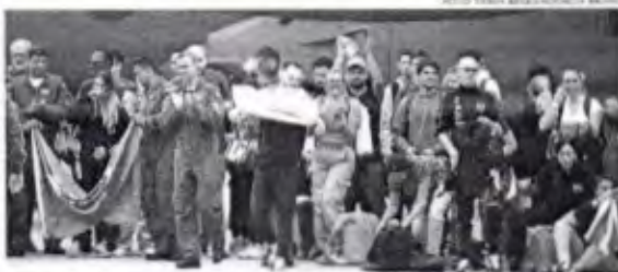
Um novo voo trazendo brasileiros de Israel deve chegar ao país nesta segunda-feira, 23

No último sábado, 21, o sétimo voo da Força Aérea Brasileira (FAB) ligado à Operação Voltando em Paz, que está sendo desenvolvida em parceria com o Ministério de Relações Exteriores, adentrou o território do Brasil transportando mais 69 pessoas para fora da zona afetada pela escalada de violência entre Israel e Palestina. O avião decolou de Tel Aviv na sexta-feira, 20, e chegou ao Recife no sábado, 21. Na capital pernambucana desembarcaram dois passageiros e os outros seguiram para a Base Aérea do Galeão, no Rio de Janeiro. Uma brasileira e suas duas filhas menores de idade também estavam entre os resgatados pela FAB, tendo sido incluídas após "contato o não comparcimento de passageiros brasileiros". Conforme relatos dos repórteres, as áreas próximas à Faixa de Gaza estão sendo bombardeadas e a recomendação é de que não se deve ir às ruas de forma alguma. Em Tel Aviv, um dos passageiros contou que se saiu da facilidade foram sequestradas. Já em Jerusalém, uma outra brasileira afirmou ter sido necessário ir para bunkers por precaução diversas vezes. Antes do momento, a operação já trouxe de volta para casa 1.204 pessoas e 44 pets. Neste domingo, 22, um outro avião da Força Aérea saiu de Tel Aviv transportando mais repatriados. A chegada está prevista para hoje, 23 e, conforme o Ministério