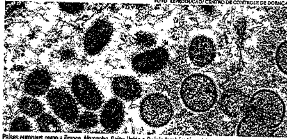
Países europeus como a França, Alemanha, Reino Unido e Suécia também já registraram casos da doença

A OMS alertou ainda, que as evidências colhidas, até o momento, sugerem que a transmissão entre se-