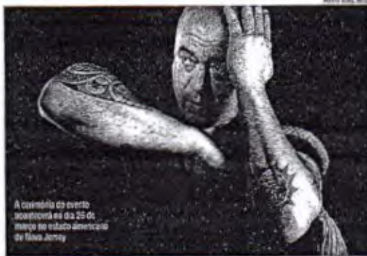
A cerimônia do evento aconteceu em 25 de março no estado americano de Nova Jersey

Atualmente, Evilazio que mora no estado de Nova Iorque, nos Estados Unidos, é um dos nomes mais importantes do MMA brasileiro,