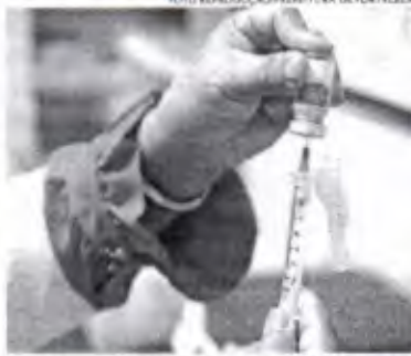
O mutirão abrange toda a sala coordenadora regional de saúde de Fortaleza

A Secretaria Municipal de Saúde (SMS) anunciou nesta quinta-feira, 07, que a capital terá mais um mutirão de vacinação contra a covid-19 para ampliar a cobertura vacinal e assegurar a proteção da população, desta vez que o Ceará está passando por uma onda de aumento de casos da doença. No primeiro mutirão, que aconteceu no sábado, 02, 4.484 doses de imunizante foram aplicadas e 14 pontos de saúde participaram. Desta vez, os fortalezenses poderão se vacinar em 16 pontos diferentes, que estarão funcionando das 8h às 16h30.