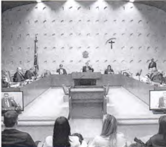
Os ministros estão analisando uma ação que trata sobre os limites constitucionais da atuação das Forças Armadas e sua hierarquia em relação aos Poderes

Ainda segundo Gilmar, "é preciso que se diga que manifestações dessa natureza não surgiram ou se intensificaram no vácuo". "Pelo contrário, constituem desdobramento de um fenômeno recente de retomada, por parte das altas cúpulas militares, de considerável protagonismo político - processo que se dá ao arrepio da norma constitucional e que tem como um de seus principais objetivos ideológicos tornar preponderante a despropositada interpretação do art. 142 da Constituição reeditada nos últimos anos e combatida nestes autos", diz o decano.