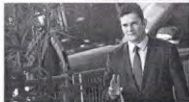
HOTEL MARCELO CAMARGO / AGENCIA REA360 O relator acolheu a tese da defesa de Moro de que apenas as despesas realizadas no Paraná deveriam ser consideradas