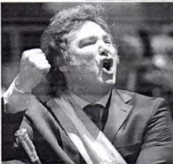
Caso o decreto seja anulado pelo Congresso, Milei prometeu realizar um plebiscito popular

O novo presidente também acusou os legisladores de defenderem o debate parlamen-